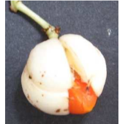
semeno v míšku